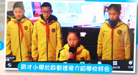
育才小學於啟動禮後介紹學校特色