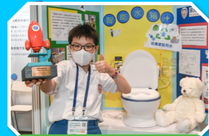
我們學校同學設計的「智能水箱」奪得小學組金獎