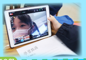
兩地學生都投入課堂，留心聆聽，積極參與