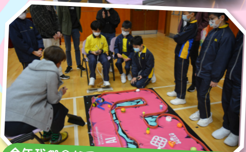
今年我們參加了Microbit人互智能比賽，你看，大家都專心調試自己的智能車呢！