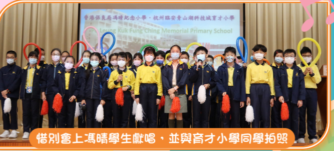
借別會上馮晴學生獻唱，並與育才小學同學合照