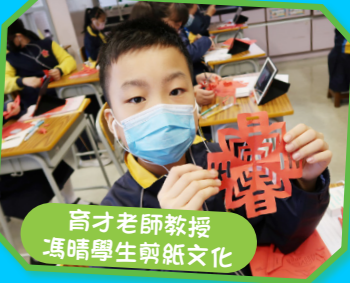
育才老師教授馮晴學生剪紙文化