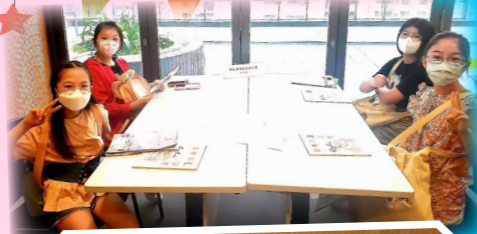
六年級同學組了隊伍參加全港即興創意寫作比賽，收穫豐富。