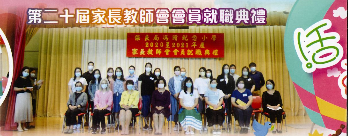
2020至2021年度家長教師會新委員就職