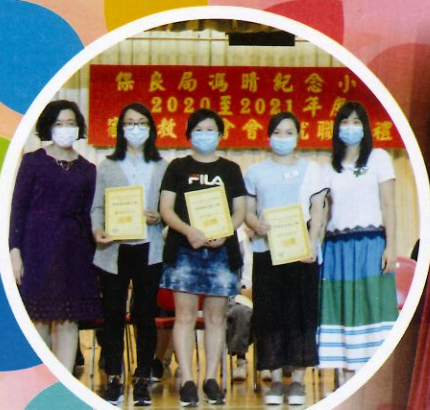
感謝各位家長義工的辛勞付出