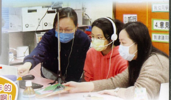
家長教師合作無間