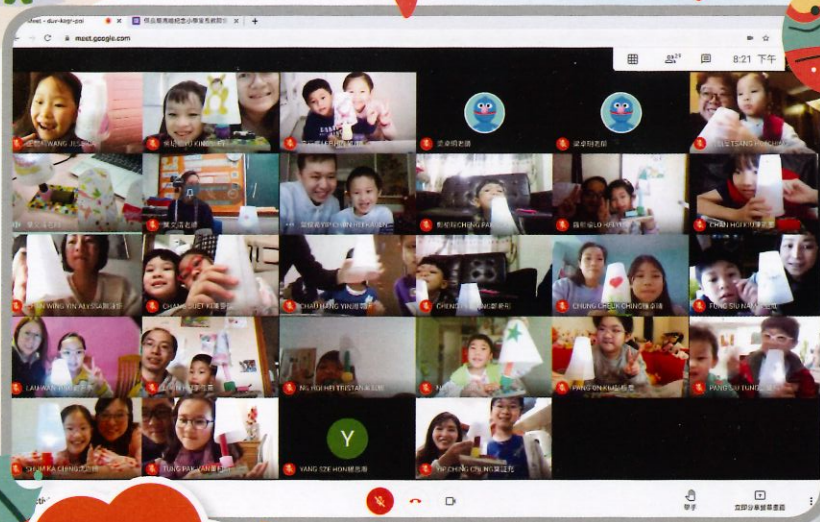
大家都興奮地舉高製成品